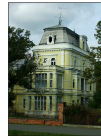
Novorenesanční vila Pollak z r. 1881

Městská naučná stezka „Člověče zastav se“ (5 km) historie – památky – osobnosti