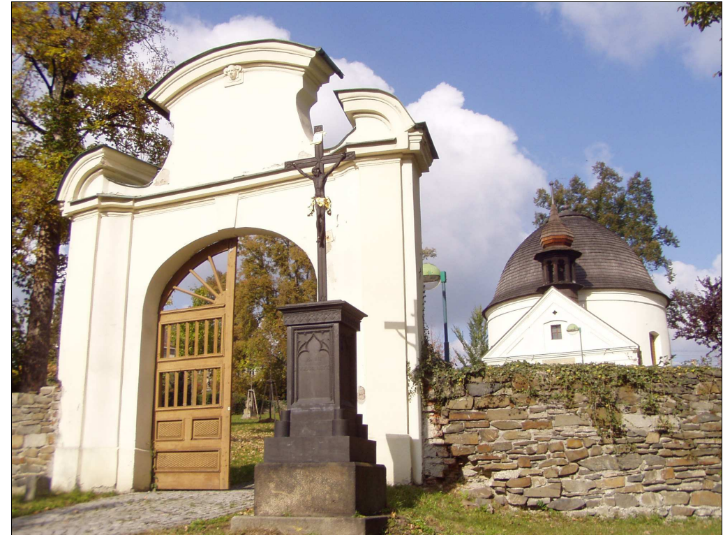
(13) čtyřlístková ohradní zeď bývalého barokního hřbitova, dnes veřejného parku se sochami a kamennými plastikami u kaple sv. Rocha a Šebestiána z r. 1632