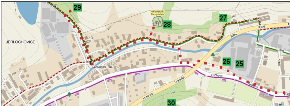
Pokračování trasy k bývalé pískovně v Jerlochovicích