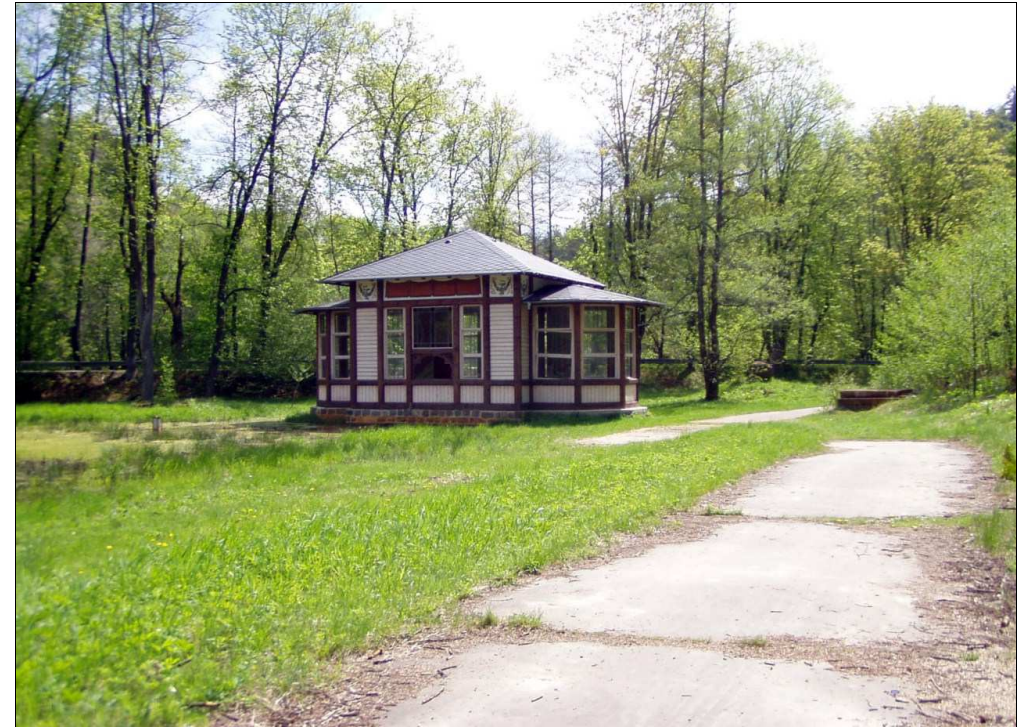
Altánek nad pramenem kyselky Marie v údolí Moravice (5) (hloubka zdroje 18,2 m, průtok 9,5 l/s, teplota 10,2 °C)