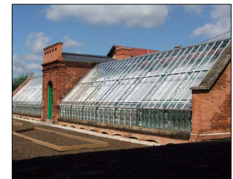
Radkov-Dubová – zámecké skleníky (10a)

Vítkov – Lhotka – Nové Těchanovice – Zálužné – Janské Koupele – Nové Zálužné – Radkov – Podhradí – Vítkov (24 km)