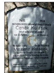
Pomník polního letce čet. Čenka Kuláska (6b)