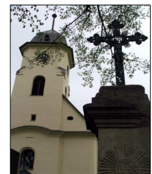
Památkově chráněné objekty v Černné ve Slezsku (1b)

Černá – N. Těchanovice – Lhotka – Vítkov – Bělidlo – Balaton – Libloulův mlýn – Mlýnský potok – Vítkov (21 km)