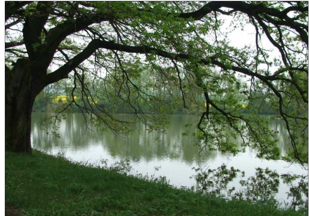
Vodní nádrž na říčce Černné – Pavelák I (4a)