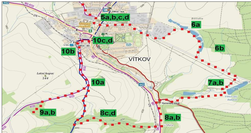
Jižní část vycházkové trasy Vítkov – Balaton – Vítkov