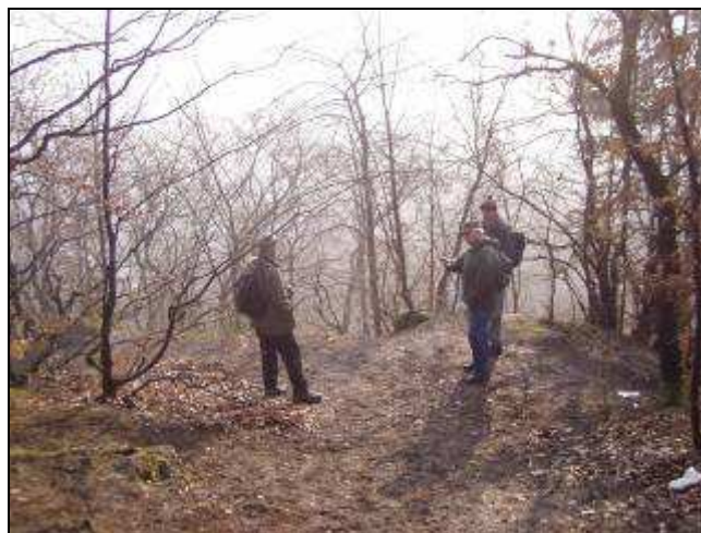
Skalka – místo plánované rozhledny

2. V souvislosti s chystanou naučnou stezkou v Odrách HSV připravuje návrh dřevěné vyhlídkové věže v Odrách v lese nad Skalkou (zaniklý malý kamenolom nad kamenným vodojemem pod zatáčkou silnice na Dobešov). Tato vyhlídková věž by měla mít podobu strážní věže, kterou má město Odry ve znaku. Nejedná se o novou myšlenku, protože již dříve takovou věž vyprojektoval v rámci své diplomové práce tehdejší student Ondřej Kunc. Oproti tomuto původnímu návrhu se členové HSV shodli v umístění této rozhledny až v lese nad Skalkou, což vyvolá potřebu postavit věž vyšší (asi 16 m), která bude převyšovat lesní porost. Nadále by však měla svou viditelnou částí (nad lesem) v maximální míře respektovat vzhled strážní věže ze znaku města.