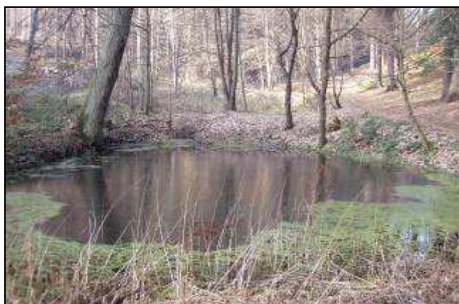
Naučná stezka Milíkov – pstruží rybníčky

1. Ve spolupráci se ZO ČSOP Odry se připravuje zřízení dvou nových naučných stezek. Naučná stezka „Milíkov“ by měla začínat a končit v Odrách, měla by mít asi 7 zastavení, dlouhá by měla být asi 6 km a měla by vést po trase: kamenný vodojem - Skalní sklepy - údolí Stodolního potoka - Tři smrky - Dvořísko - Pstruží rybníčky - Babí hrádky - Milíkov - Skalka - kamenný vodojem.