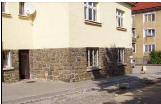
Depozitář spolku na „malé budově“ ZŠ Komenského

Historické dny byly spojeny s průvodem po městě, s bitvou žáků obou oderských základních škol, s velkou bitvou skupin historického šermu, s bohatým odpoledním a večerním programem a s výstavou zaměřenou na různá historická témata.