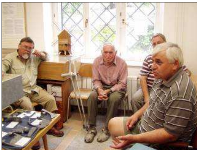
Schůzka spolku v depositáři