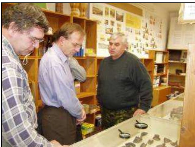
Exkurze v depozitáři