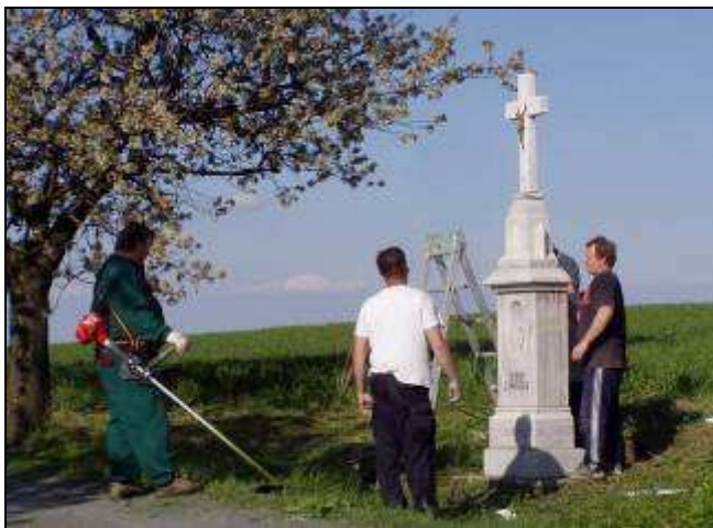
Obnova kříže ve Svatoňovicích

Po odchodu do důchodu v roce 1991 se panu Eliášovi podařilo v letech 1992 až 2002 postupně obnovit 74 křížů, božích muk i kapliček, na Oder-sku i v širším okolí. Blíže se touto jeho bohumilou činností zabýval článek v časopise Poodří.