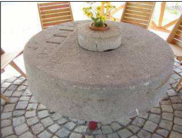
Mlýnský kámen v muzeu mlýnských kamenů J. Krále