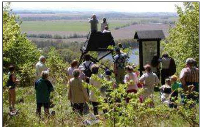
Naučná stezka Stříbrný chodník