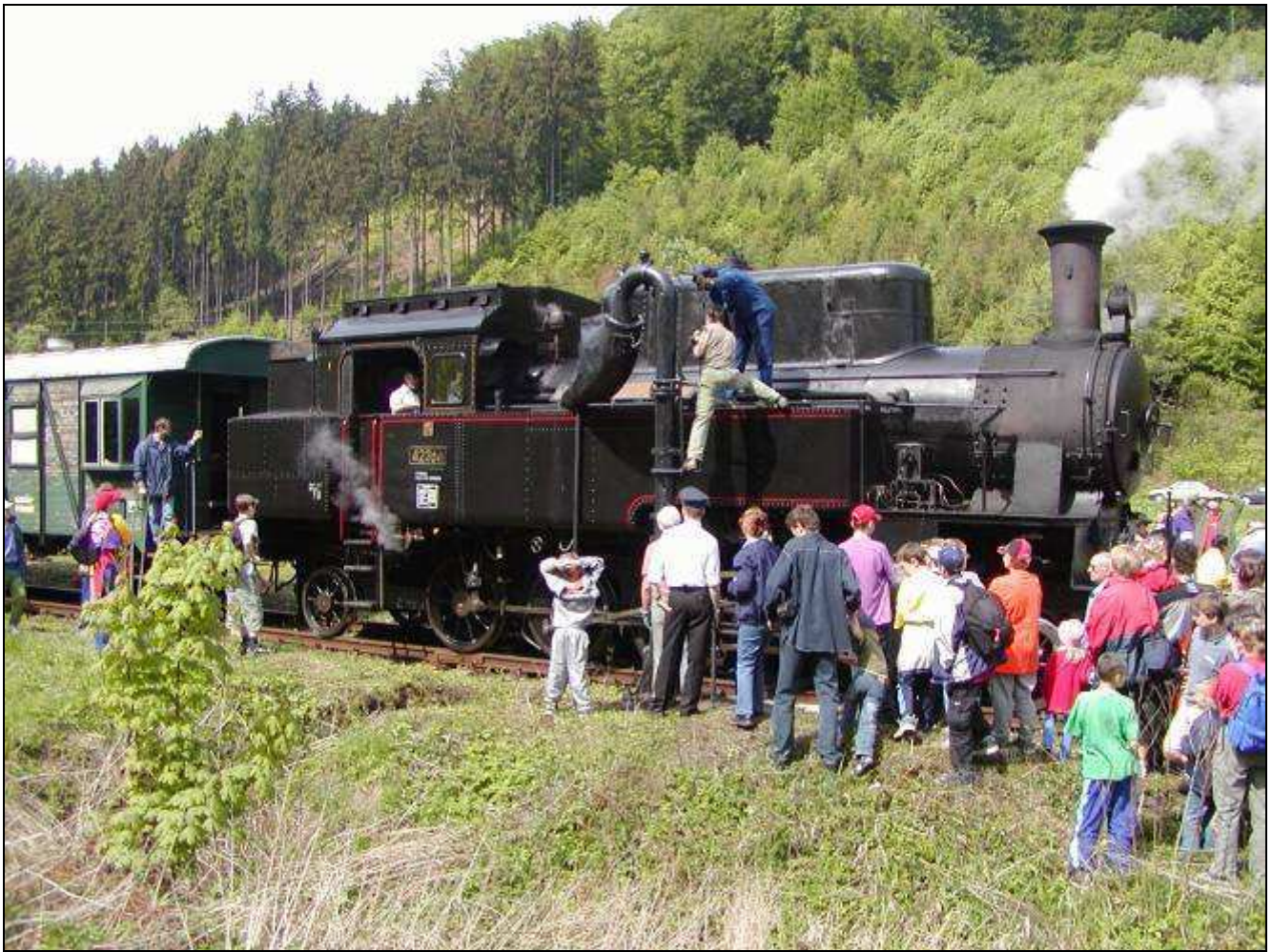
Country expres - jedna z jízď pořádaných Historicko-vlastivědným spolkem