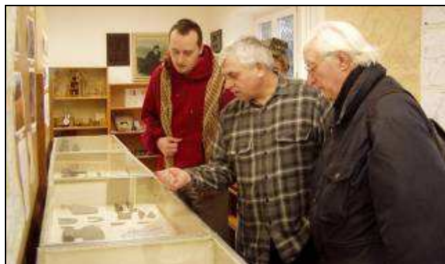
Návštěva archeologů v depozitáři spolku