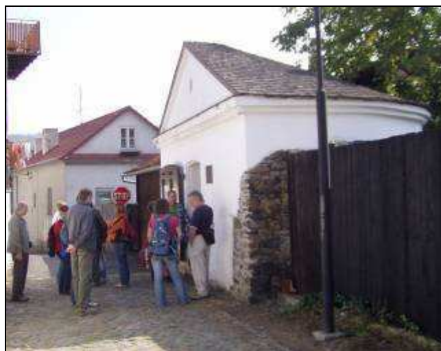
Exkurze u bašty v rámci programu Historického dne

je ji možno navštívit po dohodě na Městském informačním centru na náměstí v Odrách.